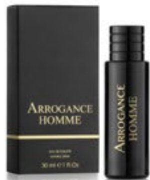
Eau de Toilette Natural Spray 30 ml