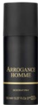
Deodorant Spray 150 ml