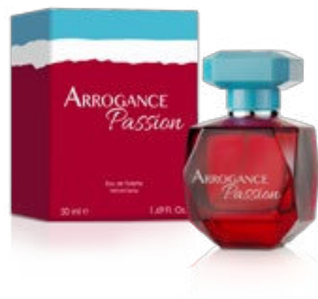
Eau de Toilette Natural Spray 50 ml