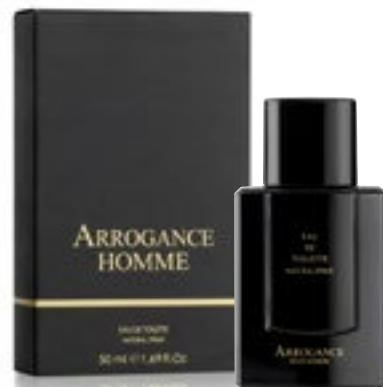
Eau de Toilette Natural Spray 50 ml