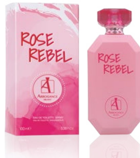
Eau de Toilette Natural Spray 100 ml