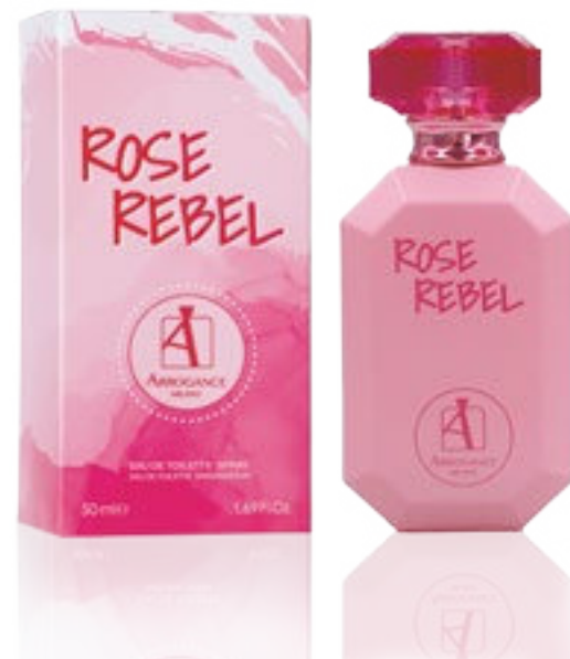
Eau de Toilette Natural Spray 50 ml