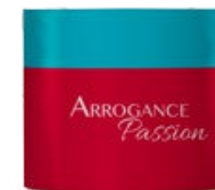
Body Cream 250 ml