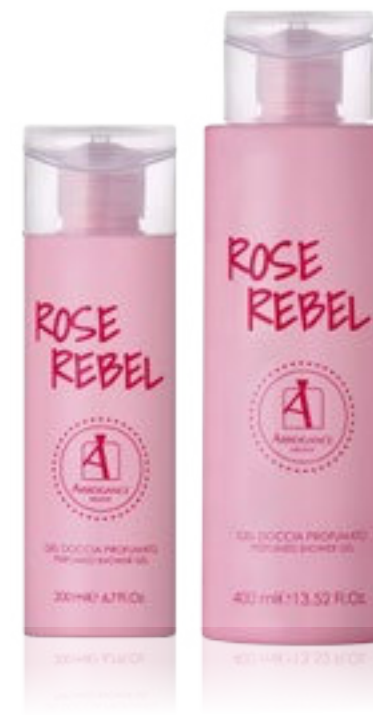
Shower Gel 200 e 400 ml