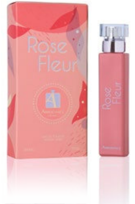
Eau de Toilette Natural Spray 30 ml