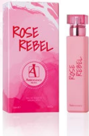
Eau de Toilette Natural Spray 30 ml