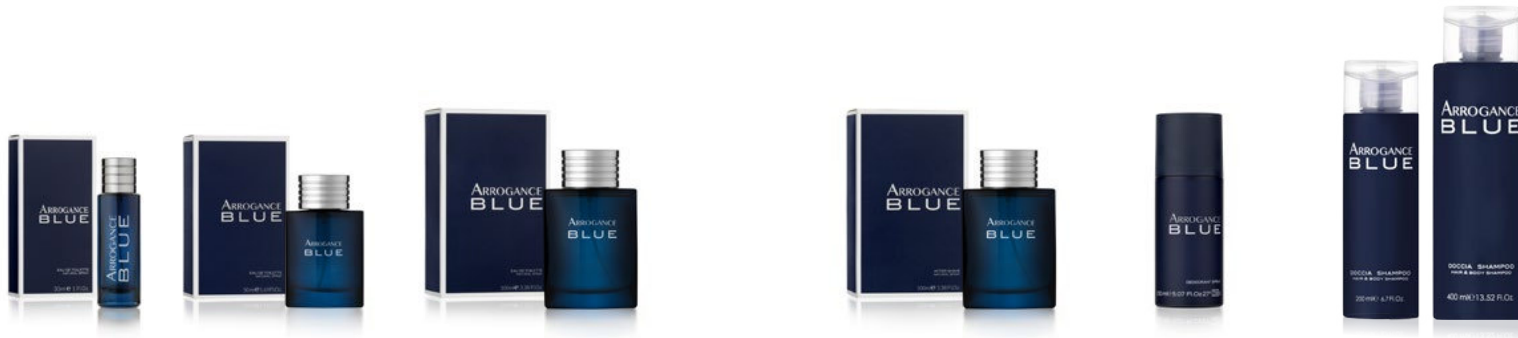
Eau de Toilette Natural Spray 30 ml