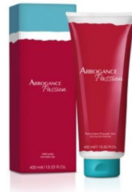
Shower Gel 400 ml