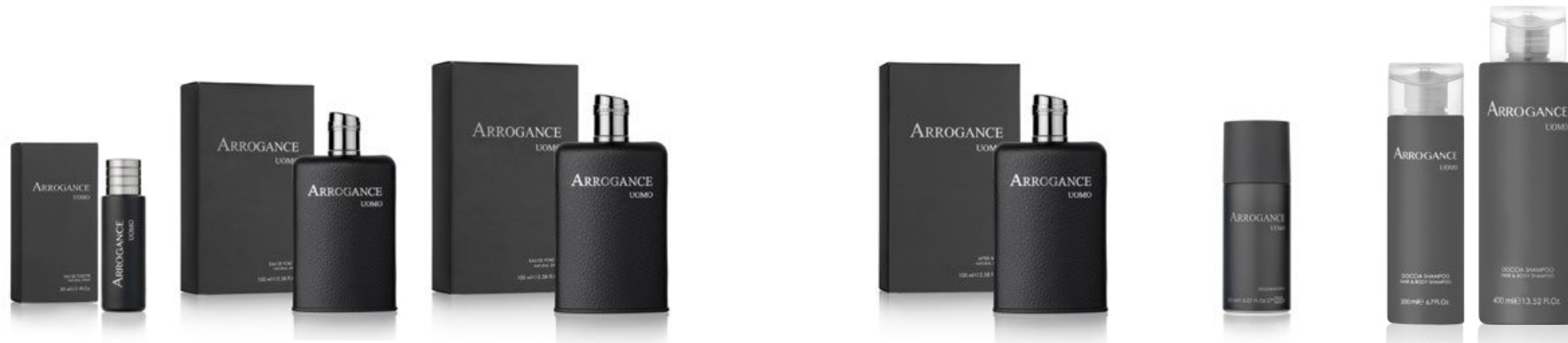
Eau de Toilette Natural Spray 30 ml