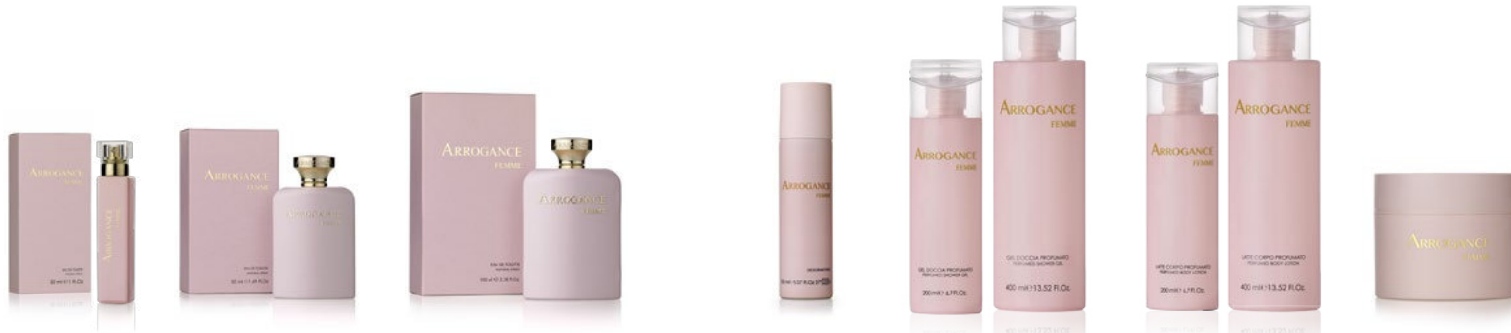
Eau de Toilette Natural Spray 30 ml