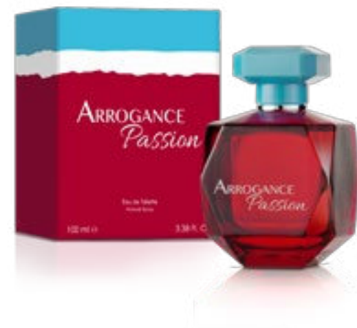
Eau de Toilette Natural Spray 100 ml