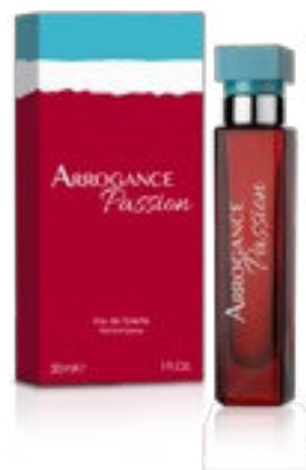
Eau de Toilette Natural Spray 30 ml