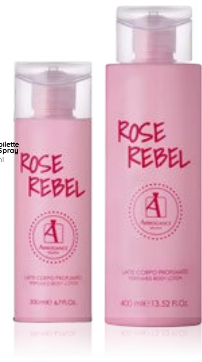
Body Lotion 400 ml