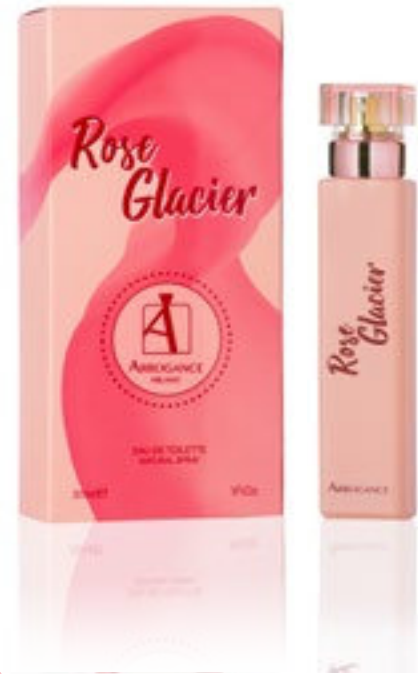
Eau de Toilette Natural Spray 30 ml